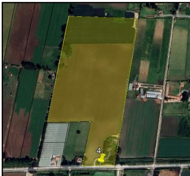
Ilustración 2. Predio El Jazmín.

En dicho recorrido en el punto 3, se identificó en el predio denominado “El Jazmín” (ilustración 2) la captación de agua superficial con motobomba del canal Chicú Gualí en las coordenadas 4°43'4.50"N - 74°10'11.52"W (ilustración 3), canal que hace parte del sistema hidráulico de manejo ambiental y de control de inundaciones de La Ramada, de conformidad con el acuerdo CAR 037 de 2014.