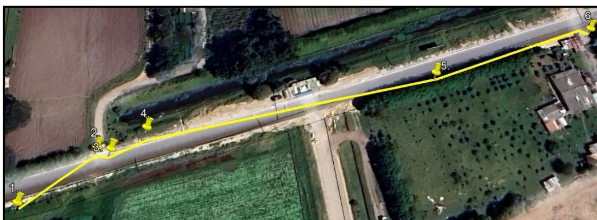
Ilustración 1. Recorrido verificación ambiental - Vereda La Florida.

Se realizó recorrido de control y vigilancia en la vereda La Florida el día 26 de julio de 2024, desde las coordenadas 4°43'2.88"N - 74°10'12.42"W hasta las coordenadas 4°43'7.02"N - 74°10'8.34"W (ver ilustración 1. Ruta amarilla), con el fin de verificar las condiciones ambientales, identificar posibles afectaciones a los recursos naturales y realizar las acciones de prevención correspondientes.