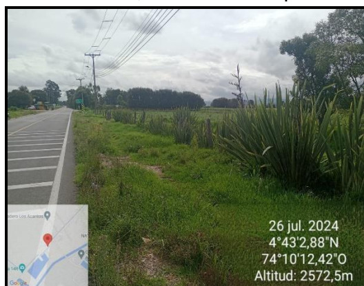
Ilustración 6. Evidencia recorrido, punto 1.

Adicionalmente, en los puntos 1, 3, 5 y 6 no se evidenciaron anomalías como: presencia de motobombas, inadecuada disposición de residuos sólidos, quemas a cielo abierto, etc.