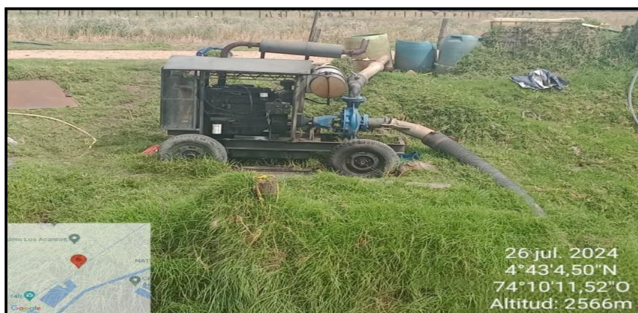
Ilustración 3. Localización motobomba, punto 4.