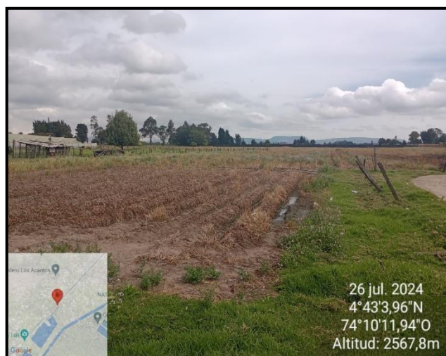
Ilustración 5. Actividad agrícola, punto 2.

En el predio se realizan actividades agrícolas, como se observa en la siguiente ilustración: