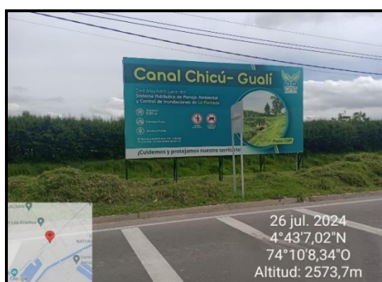
Ilustración 8. Evidencia recorrido, punto 5.