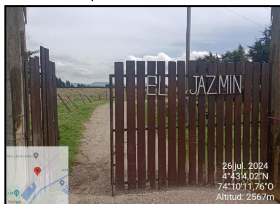
Ilustración 7. Evidencia recorrido, punto 3.